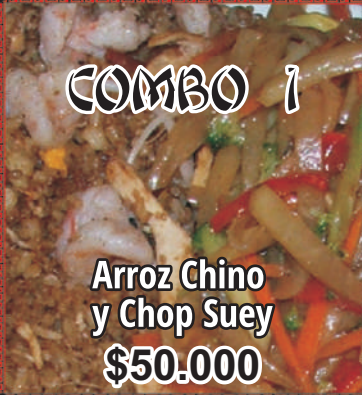
Arroz Chino y Chop Suey $50.000