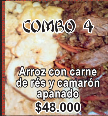
Arroz con carne de res y camarón apanado $48.000