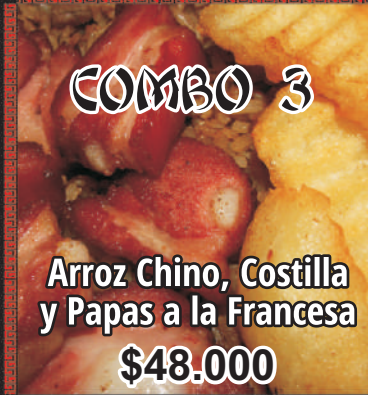
Arroz Chino, Costilla y Papas a la Francesa $48.000