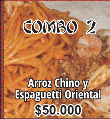
Arroz Chino y Espagueti Oriental $50.000